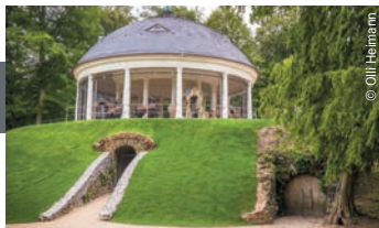
Karussell im Staatspark Hanau-Wilhelmshaus

Der Konzert- und Theatersaal des CPH bietet Hörgenuss auf höchstem Niveau, insbesondere für konzertante Musik. Eindrücklich zu erleben ist dies bei den Konzerten der Reihe „Congress Park Sinfonie“ mit der Neuen Philharmonie Frankfurt. Daneben ist der Paul-Hindemith-Saal auch Bühne für Musical-, Show- und Theaterproduktionen, die rund ums Jahr im CPH gastieren.