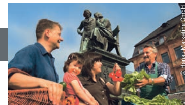
Hanauer Wochenmarkt | Brüder-Grimm-Nationaldenkmal