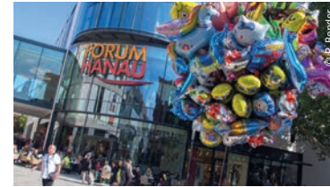
Forum Hanau & Kulturforum