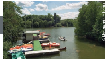
Bootsverleih an der Kinzigmündung

Der Innenstadtbau hat Hanau um viele attraktive Einkaufsmöglichkeiten bereichert. Das Forum Hanau lockt am Freiheitsplatz mit über 90 Läden, zahlreichen gastronomischen Angeboten und dem Kulturforum. In den umliegenden Straßen gibt es ebenfalls viele spannende Shops, Cafés und Restaurants zu entdecken. Mittwochs und samstags bieten beim Hanauer Wochenmarkt rund 100 Stände ihre Waren feil.