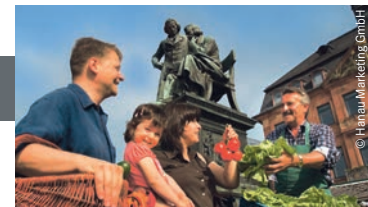
Hanauer Wochenmarkt | Brüder-Grimm-Nationaldenkmal