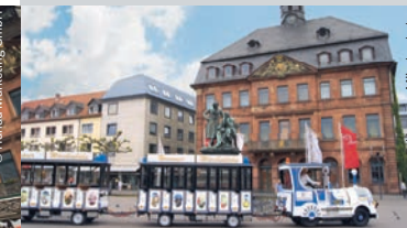
Hanauer Märchenbahn | Neustädter Rathaus