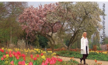
Schlossgarten am Congress Park Hanau