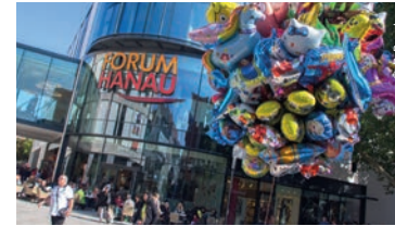
Forum Hanau & Kulturforum